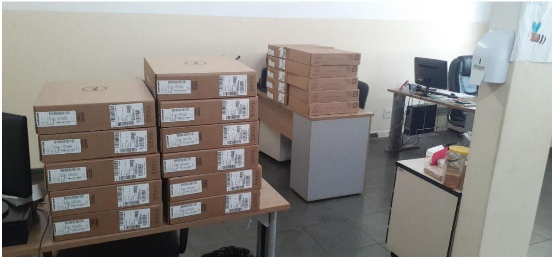
Recebimento dos equipamentos